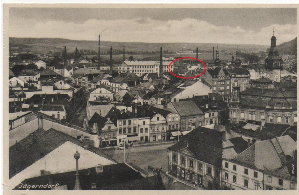
Obr.: Pohled na centrum Krnova kolem roku 1930, červeně vyznačena synagoga a budova dnešního spolkového domu