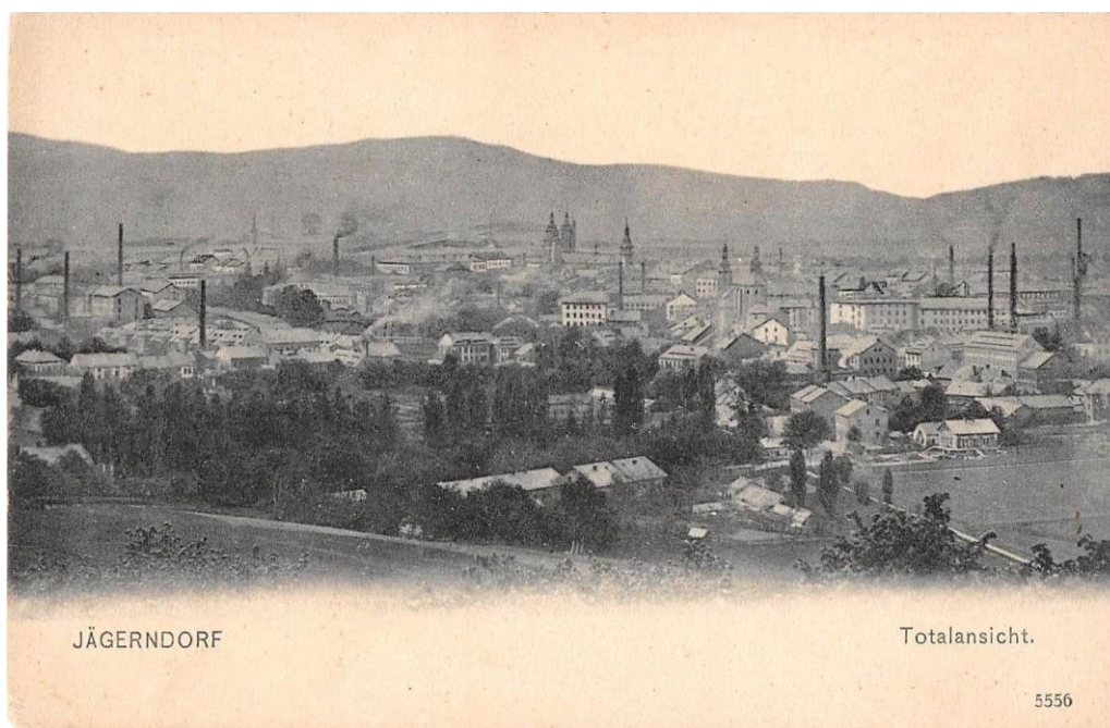
Obr.: Pohled na Krnov/Jägerndorf z počátku dvacátého století