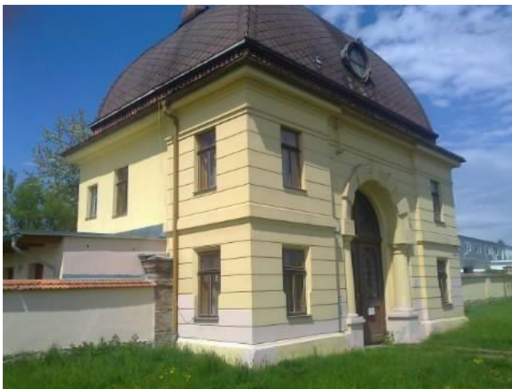
Obr.: Obřadní síň židovského hřbitova v Šumperku.

Od srpna 2013 se členové Jesenického horského spolku zapojili do údržby areálu židovského hřbitova a obřadní síně v Šumperku. Židovský hřbitov v Šumperku byl zřízen v roce 1911, ve stejném roce postavena i obřadní síň, zvýšená nástavbou kupole v roce 1932. Areál je v majetku Federace židovských obcí v ČR. Zapojili jsme se do osekávání plochy hřbitova a drobných oprav služebního bytu v objektu obřadní síně. V letech 2014-5 byl služební byt dovybaven a byly zrealizovány drobné opravy, před obřadní sň jsme osadili historické žulové patníky z roku 1870 k vymezení prostoru před obřadní síní. V roce 2016 byla doplněna žulová dlažba před vstupem. Zpřístupňování areálu hřbitova probíhá i ve spolupráci s našim partnerským sdružením Respekt&Tolerance z Loštic, které pečuje o synagogy v Lošticích a Úsově. V dalších letech bychom chtěli rozšířit zpevněnou plochu před obřadní síní.